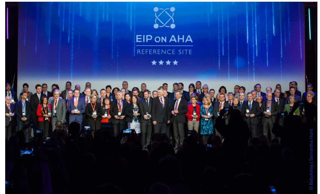
Reference Site Verleihung: 07.12.2016 in Brüssel